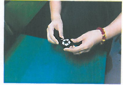
3、参考《检查要领书》进行外观检查。异常品放入红色不良品收纳盒内。