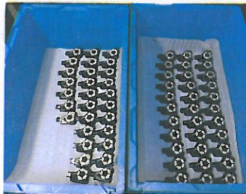
5、冷却后的产品暂时放在蓝色周转箱内, 每层需垫一张珍珠棉。产品分穴号放置。