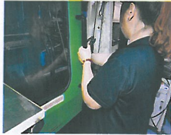
2、开模后, 作业员左手打开安全门, 右手伸入模具内部取出产品。