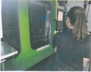
1、作业员在机台旁准备, 左手握住安全门手柄。