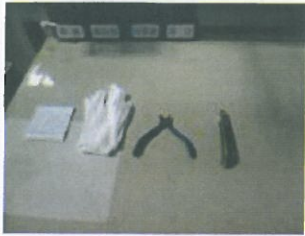
1、作业前工具的准备