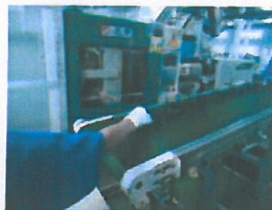
2、从运输带上拿取冷却好的产品