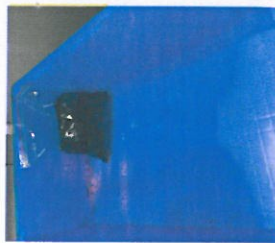
7、满箱后贴附移动票放到待检区,