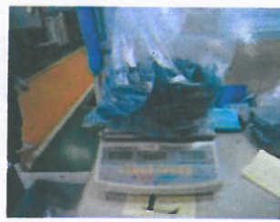
6、合格品放入胶袋中, 每袋1000个。