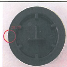
⑤浇口部位: 浇口剪平整, 高凸、凹陷不可有;