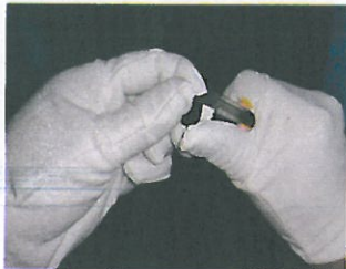
5、高出部位用刀片削平