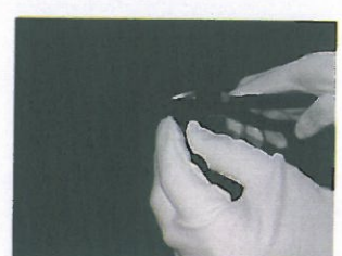
4、用剪钳将水口剪除