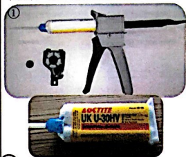
图片：第二次成形加工步骤